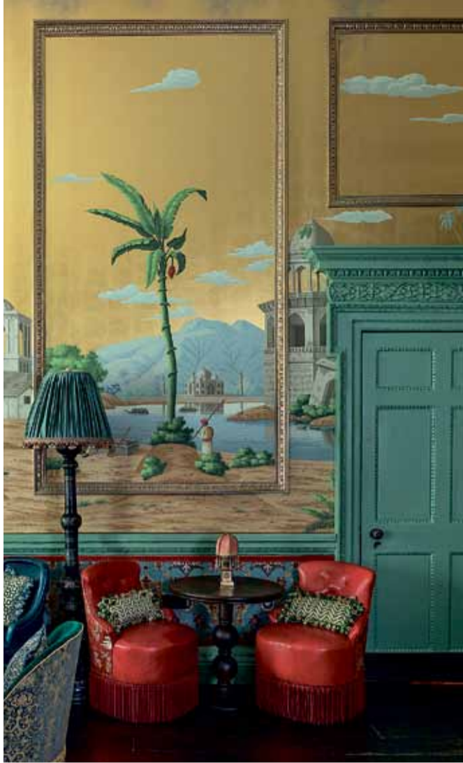
● Μοτίβα και περίπλοκες λεπτομέρειες βασισμένες στο έργο «Ο Κήπος της Εδέμ» του Johann Wenzel Peter.