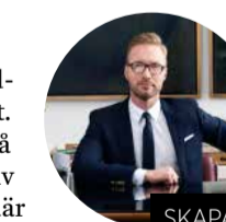
SKAPADE MILJÖN. Martin Brudnizki.

Genom atriet stiger sorlet från den stora baren, som är hotellets samlingspunkt. Det är en